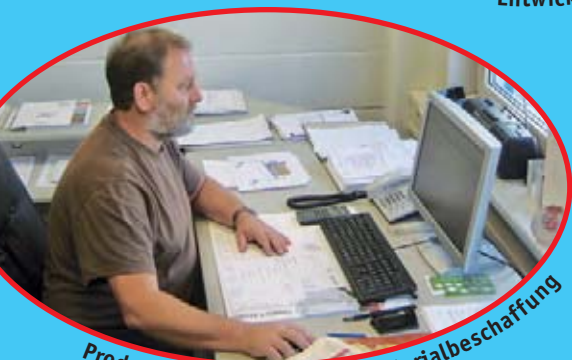
Produktionsvorbereitung · Materialbeschaffung