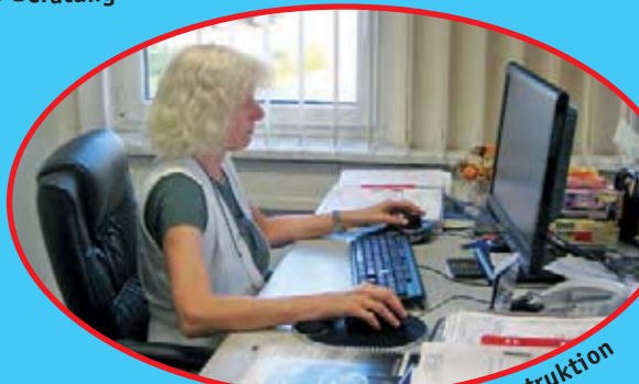
Entwicklung · Konstruktion