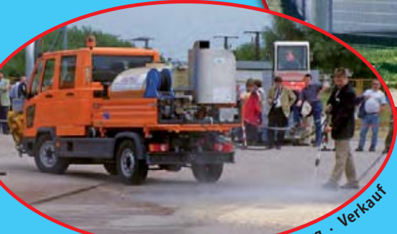
Technische Beratung · Vorführung · Verkauf