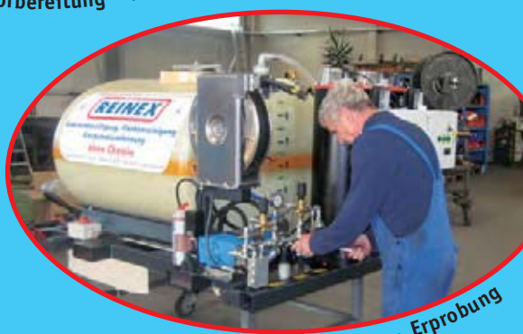
Fertigung · Erprobung

Als leistungsstarkes Unternehmen bietet REINEX seinen Kunden im Bereich Hoch- und Niederdrucktechnik innovative Problemlösungen, eine hohe Verarbeitungsqualität und Präzision im Detail. Dazu Flexibilität im Lieferservice und Produkte, die sich durch Wirtschaftlichkeit, Maßgenauigkeit und Vielfalt auszeichnen. Eine größtmögliche Ausrichtung auf die Bedürfnisse der Anwender ist dabei für die Entwicklung unserer Produkte maßgebend. Dass REINEX diese Leistung erbringen kann, verdankt das Unternehmen allein dem Können und dem Verdienst seiner Mitarbeiter. Ständiger Kontakt zu Kunden und dauernde Gesprächsbereitschaft helfen, die einzelnen Produkte abzurunden und inspiriert durch unseren Erfindergeist, neue Lösungen zu finden. Erst der kontinuierliche Kontakt zum Anwender garantiert, dass immer nur ausgereifte Produkte zum Anwender kommen. Jahrzehntelange, handwerkliche Erfahrung und ständige Produktinnovationen sind weitere Grundlagen unseres Erfolges.