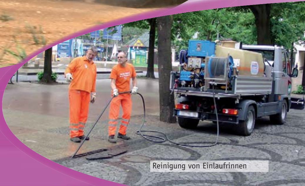
Reinigung von Einlaufrippen