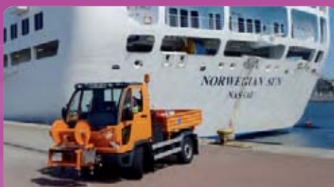
Fäkaliensorgung von Schiffen