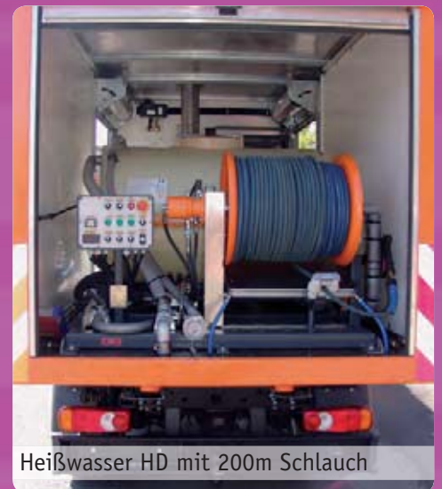
Heißwasser HD mit 200m Schlauch