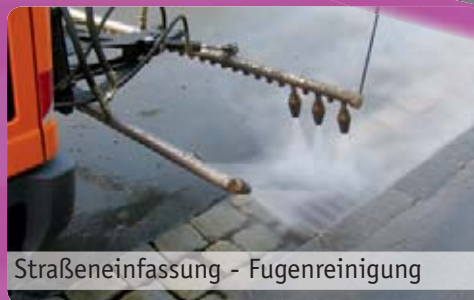
Straßeneinfassung - Fugenreinigung